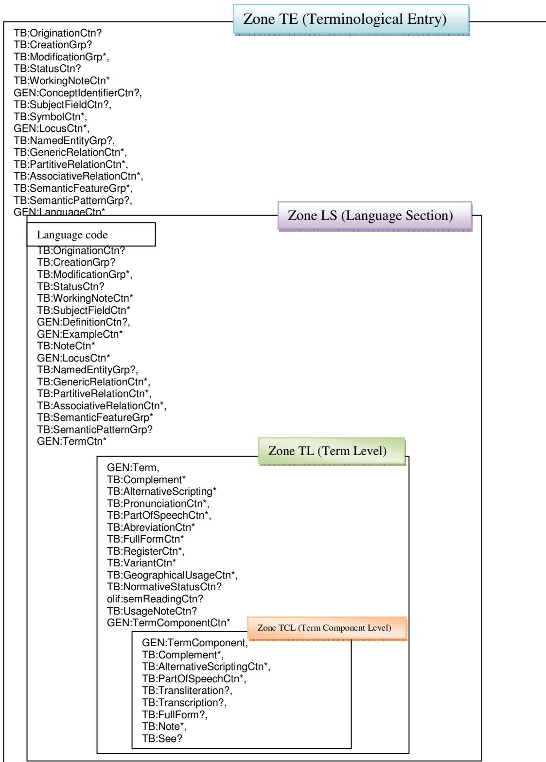
Fig. 3 : Structure d'une fiche terminologique conforme TMF sous Genetrix